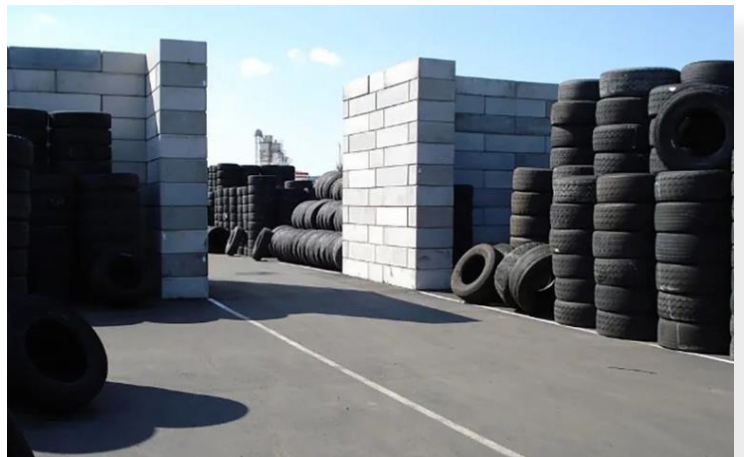
קירות הפרדה למחיצות