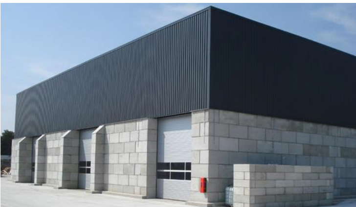
בנייה קלה ומהירה