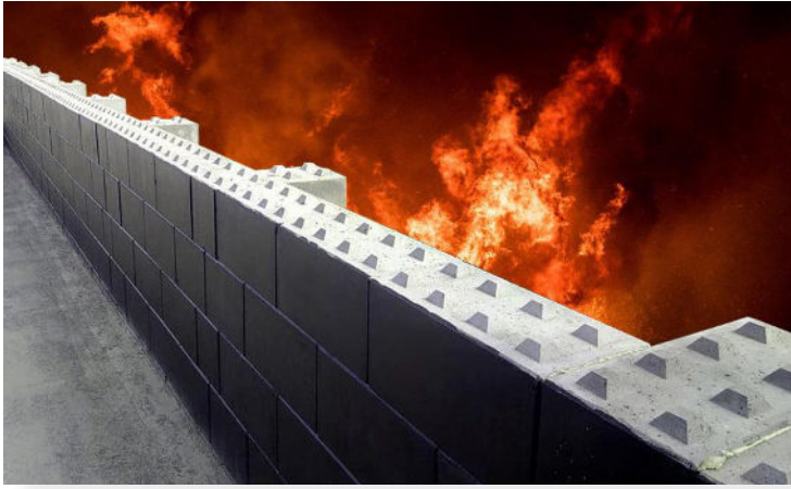
קיר הגנה מאש